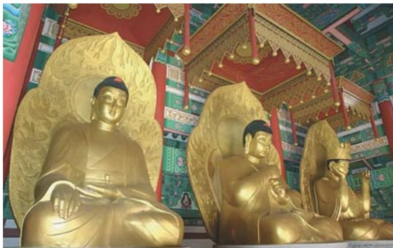
10. Буддистский храм (Корё).