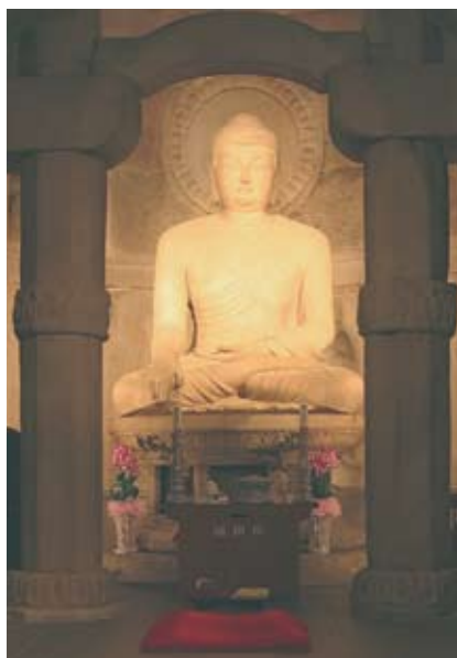
9. Статуя Будды в храме Соккурам (Объединенное Силла).