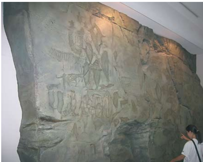
4. Петроглифы Пангудэ.