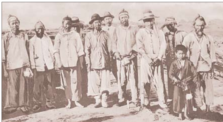
18. Корейские иммигранты на российском Дальнем Востоке (конец XIX в.).