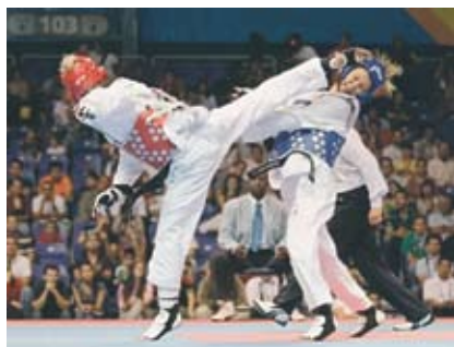
16-17. Тхэквондо – корейский вид единоборства. Олимпийский вид спорта.