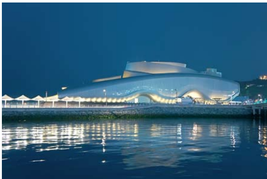
26. Тематический павильон на EXPO-2012 в Йосу (Южная Корея).