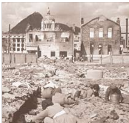
21-22. Корейская война (1950-1953 гг.). Сеул после бомбежки.