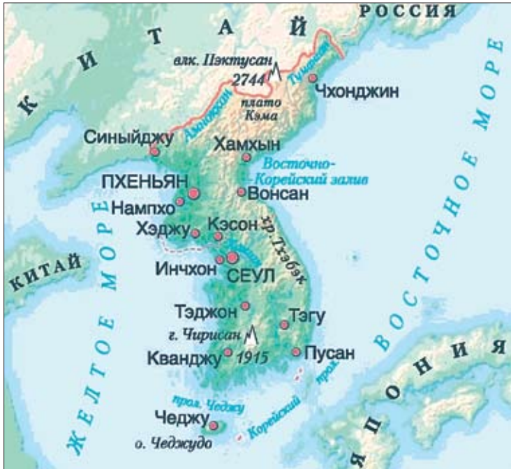
1. Корейский полуостров.