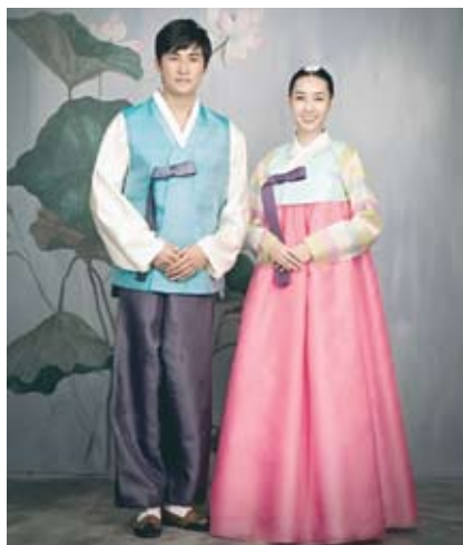
13. Корейская национальная одежда.