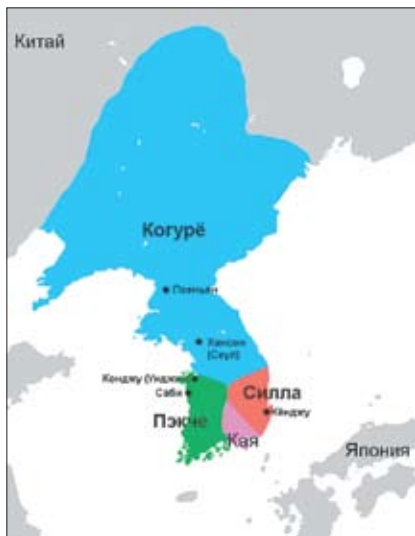
8. Корейский полуостров в период троецарствия.