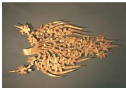
6. Золотая диадема вана Мурёна (Пэкче).