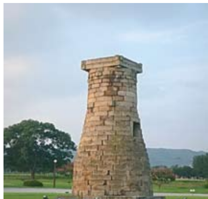
7. Обсерватория Чхосондэ (Силла).