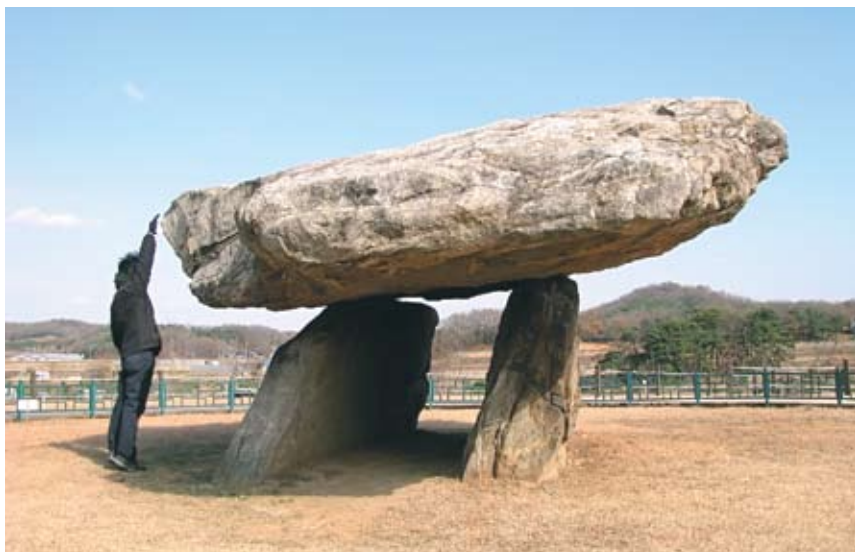
3. Дольмен – древнее погребальное сооружение.