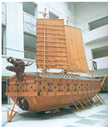
12. Корабль-черепаха, использованный во время Имджинской войны (конец XVI в.).