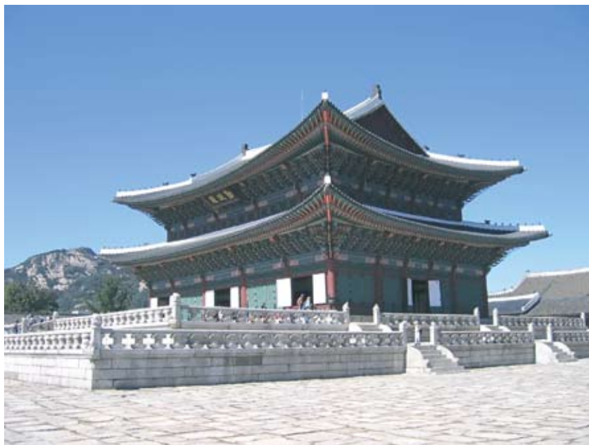
11. Тронный зал дворцового комплекса Кёнбоккун в Сеуле. (Династия Чосон, XIV в.).