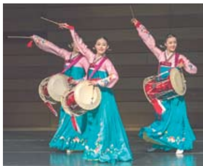
14. Корейский национальный танец.