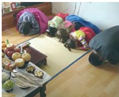
15. Поминальный обряд. Поклон и подношение яств умершим предкам.