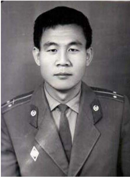
Служба в МВД Узбекской ССР.