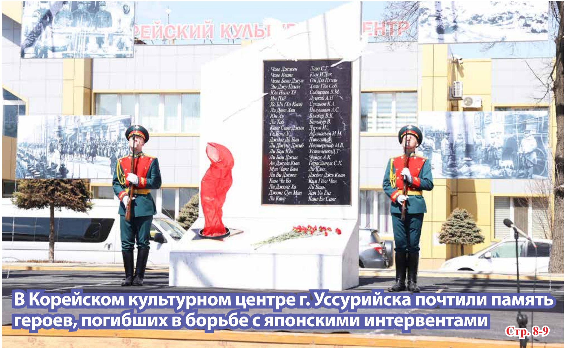
В Корейском культурном центре г. Уссурийска почтили память героев, погибших в борьбе с японскими интервентами