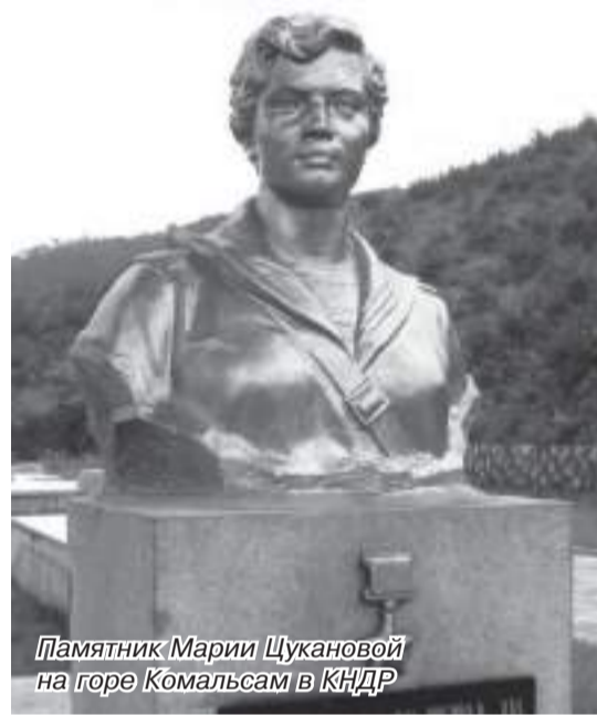
Памятник Марии Цукановой на горе Комальсам в КНДР

«приток», «хэ» - «река». По всей вероятности, «длинное протяжение реки» или попросту «длинная река». Еще раньше, в VIII-X веках при впадении реки Янчихе в бухту Экспедиции существовал город-порт под возможным названием Янь. Он имел место в административном округе Янь государства Бохай в раннем средневековье. Более того предполагаемый