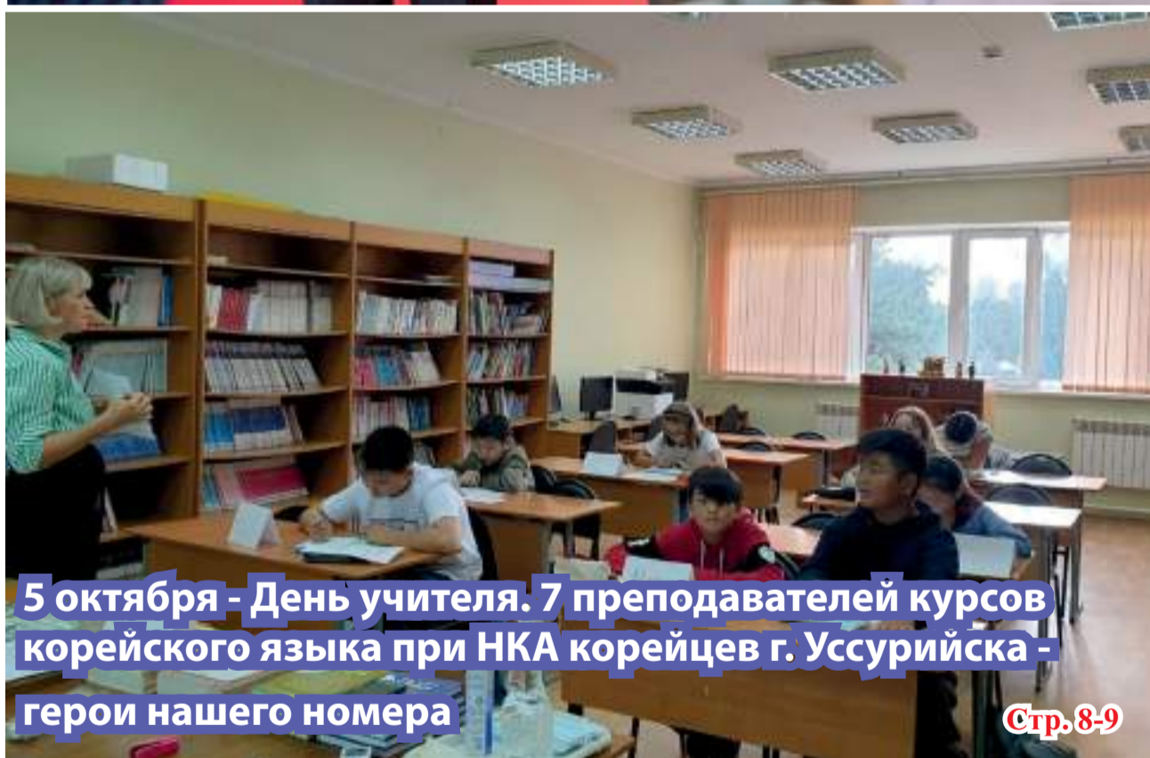
5 октября - День учителя. 7 преподавателей курсов корейского языка при НКА корейцев г. Уссурийска - герои нашего номера