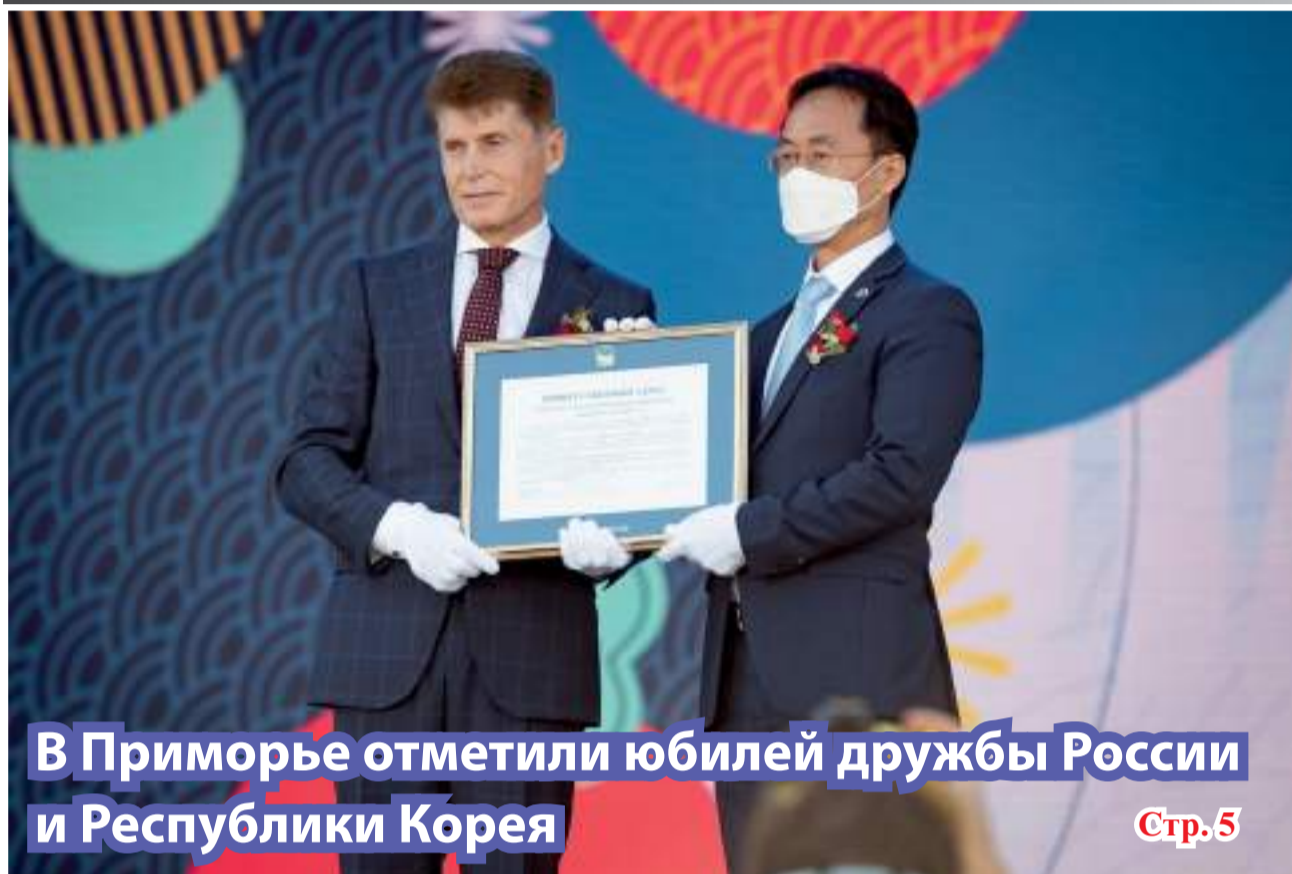
В Приморье отметили юбилей дружбы России и Республики Корея