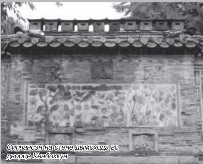
Сипчансэ на стене дымохода во дворце Кенбоккун

С древних времен черепаха в Корею считалась символом бессмертия и доброго предзнаменования. По преданию, она живет 10 тысяч лет и наравне с драконом, фениксом и тигром является одним из священных животных, духов-хранителей сторон света. Черепаха Хенму («черный воин») отвечает за север - самое суровое направление как с климатической, так с географической точки зрения, ведь именно с севера совершали свои набеги маньчжуры и чжурчжени - основные враги корейского государства.